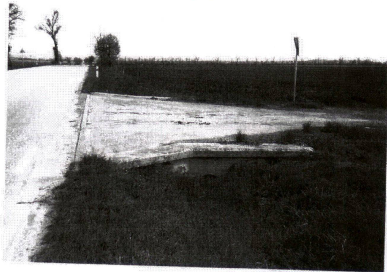
OBEC SOBOTOVICE, Sobotovice 176, 664 67 Syrovice